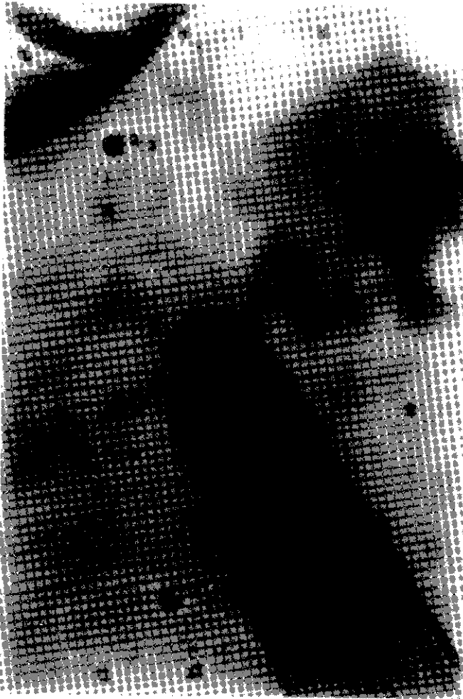
شکل ۲: بخش فوقانی انگل کرمی Hysterothylacium sp. در دستگاه گوارش لاک‌پشت برکه‌ای مرکز ماهیان خاویاری گرگان (بهار ۱۳۸۰)