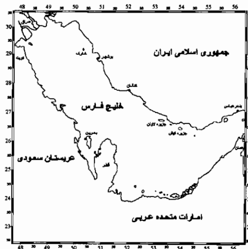
شکل ۱: منطقه مورد بررسی از منطقه دارسرخ تا طولاً در آب‌های استان هرمزگان

بمنظور نمونه‌برداری در فصل صید میگو به همراه یک فروند قایق موتوری بطرف صیدگاه عزیمت نموده و بر روی شناورهای میگوگیر استقرار یافته و پس از تخلیه صید بر