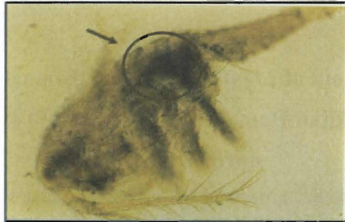
شکل ۲: پروسکونید انگل لیگولا اینتستینالیس در حفره شکمی کوه‌پود

آگاهی از چرخه انگل در این منبع آبی و دستیابی به اطلاعات مورد نیاز از جمله میزان آلودگی میزبانهای واسط (باروپایان پلانکتونی و ماهیان) و پرندگانی که بیشترین میزان آلودگی و مهمترین نقش در انتشار این انگل را بعنوان میزبان اصلی در این چرخه دارند، بررسی‌های بیشتری باید انجام شود.