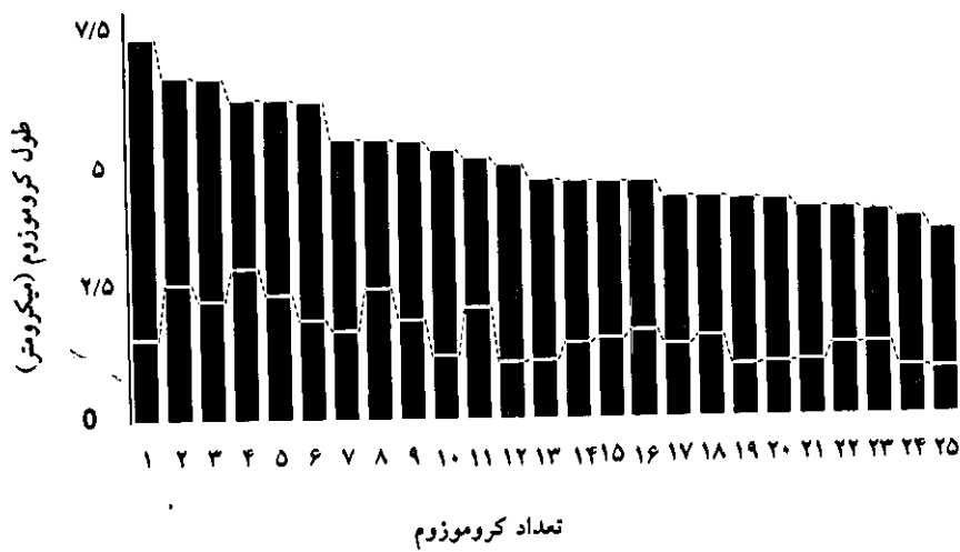
نمودار ۱: ایدیوگرام هاپلوئیدی ماهی گل چراغ ( Garra rufa )، n=25 .