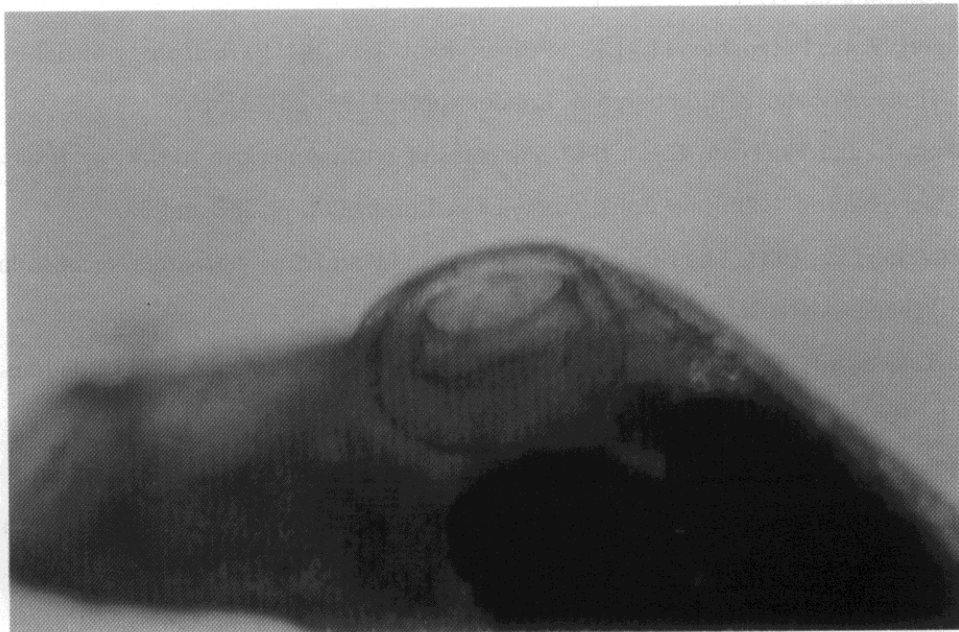
شکل ۲: عکس از بادکش شکمی انگل آسیمفیلودورا تینکا جدا شده از لای ماهیان تالاب انزلی با نمای جانبی (بزرگنمایی \times 50 )