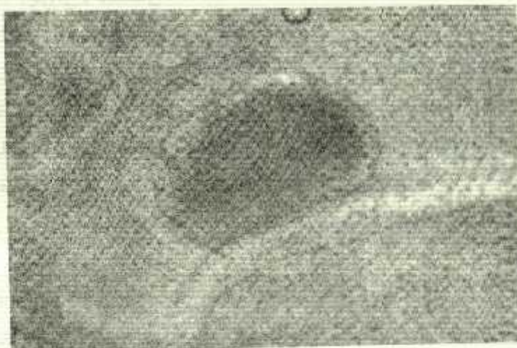
شکل ۳: کیست انگل Myxobolus musayevi کنار تیغه‌های ثانویه آبشش سیاه ماهی از رودخانه تجن استان مازندران رنگ آمیزی هماتوکسیلین - اتوزین - بزرگنمایی \times 210