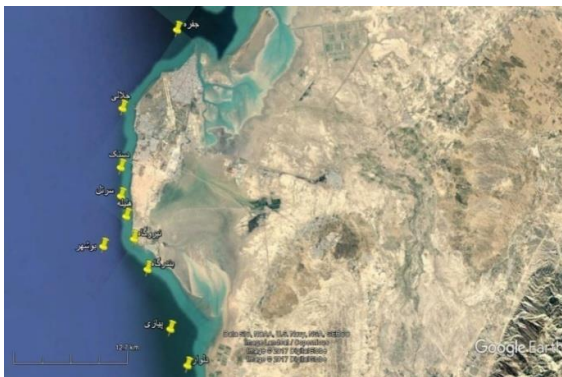
شکل ۱: نقشه منطقه و موقعیت ایستگاه‌های مورد بررسی Figure 1: Map of the studied region and sampling stations

and Richardson, 1977) انجام شد. در آزمایشگاه کلیه نمونه‌ها به کمک کلیدهای معتبر از جمله (Todd and Laverack, 1991; Smith and Johnson, 1996; Chihara and Murano, 1997; Al-Yamani et al. , 2011) و با استفاده از میکروسکوپ اینورت نیکون مدل Ti-S شناسایی و شمارش گردیدند.