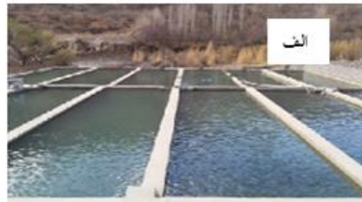
شکل ۱: الف: استخر پرورش ماهی منطقه سیرج ب: استخر پرورش ماهی منطقه کوهپایه Figure 1: A: Sirch area fisheries pool B: Kouhpayeh area fisheries pool